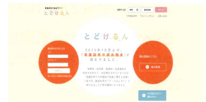
「とどけるん」のトップページ