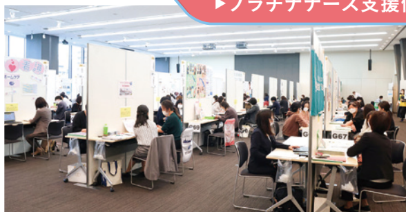
看護職と求人施設の就業相談会