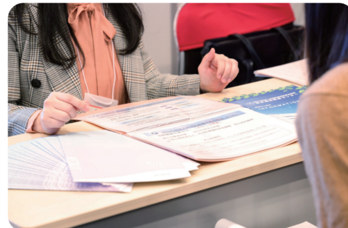
2023年12月 看護のお仕事応援フェア 就職説明会の様子